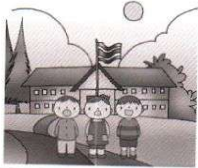
เวลา ๐๙.๐๐ - ๐๙.๓๕ น. สวดมนต์ และพิธีกรวดมนต์เช้า