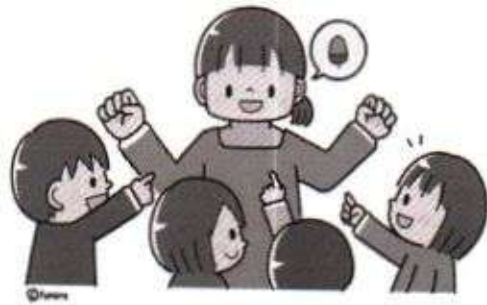
เวลา ๑๕.๓๐ - ๑๕.๐๐ น. ศึกษาวาดรูปกิจกรรม ภาชนะบ้าน