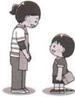
๐๙.๐๐ - ๐๙.๐๐ น. รับเด็กเป็นรายบุคคล