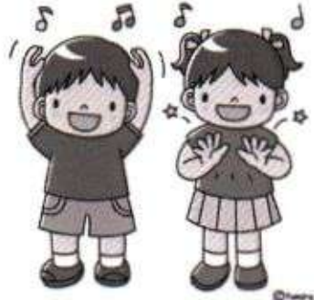
เวลา ๐๙.๐๐ - ๐๙.๓๐ น. กิจกรรมเคลื่อนไหวและจังหวะ