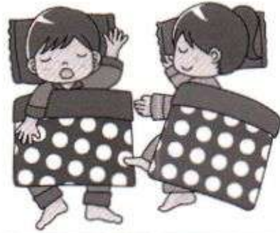
เวลา ๑๒.๐๐ - ๑๔.๐๐ น. นอนพักผ่อนกลางวัน เก็บที่นอน ล้างหน้า