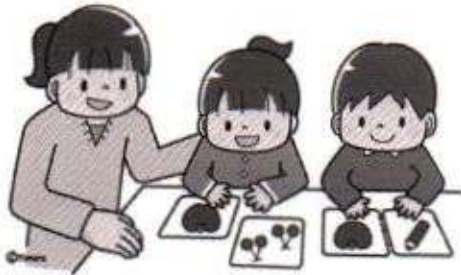
เวลา ๑๔.๓๐ - ๑๕.๐๐ น. กิจกรรมบูรณาการศิลปะ