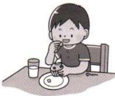
เวลา ๐๙.๓๐ - ๐๙.๓๐ น. พักรับประทานอาหารว่าง