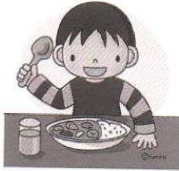
เวลา ๑๑.๐๐ - ๑๒.๐๐ น. พักผ่อนรับประทานอาหารกลางวัน