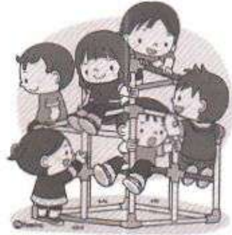
เวลา ๑๐.๓๐ - ๑๑.๐๐ น. กิจกรรมกลางแจ้งกิจกรรมเสรี