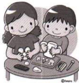
เวลา ๐๙.๓๐ - ๑๐.๐๐ น. กิจกรรมสร้างสรรค์และเล่นกลางแจ้ง