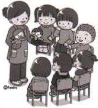
เวลา ๑๐.๐๐ - ๑๐.๓๐ น. กิจกรรมสวดมนต์ประกอบเพลง