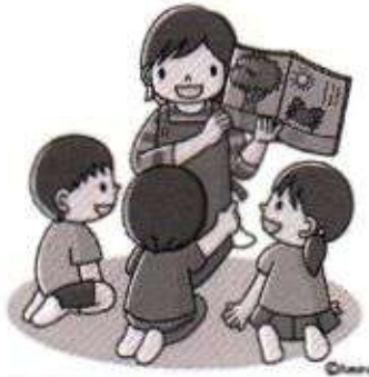
เวลา ๐๙.๓๕ - ๐๙.๐๐ น. สอนบทกวีร่วมและเหตุการณ์